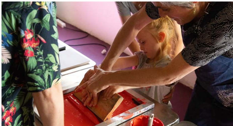
Atelier dessin et sérigraphie, autour du spectacle Pomelo se demande, Cie Et compagnie, 2025