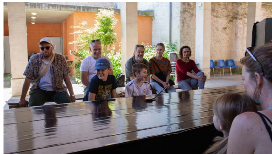
Spectacle participatif - Artifices, Cie Areski - 2025 - @Sandy Korzekwa