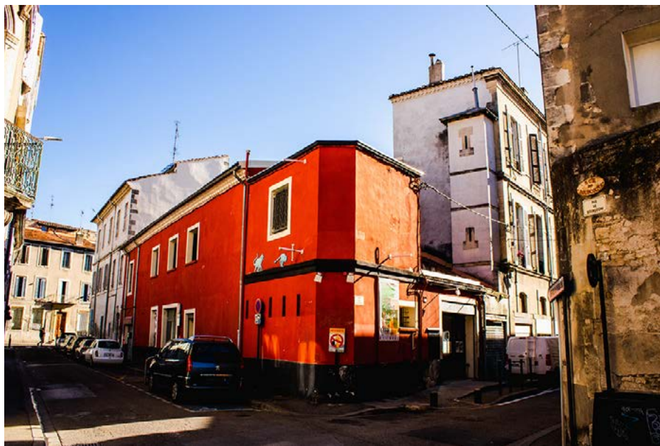
Le Périscope, vue de la rue