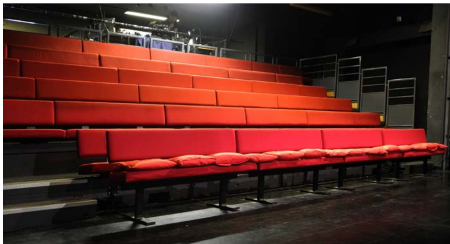
Les gradins du PÉRISCOPE

Le PÉRISCOPE souhaite développer la diffusion hors les murs (dans l'espace public et chez ses partenaires). Son champ d'action se concentre sur la ville de Nîmes, avec la volonté de renforcer les partenariats avec les structures culturelles, sociales et éducatives du territoire nîmois.