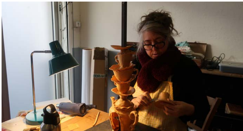
Résidence de création, spectacle jeune publics : Malice du retour du pays des merveilles, Cie Les voyageurs Imobiles, 2024

Cette liste des ateliers/rencontres est non exhaustive et les ateliers sont à construire avec vous, en fonction des besoins pour vos classes.