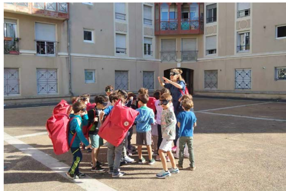
Représentation scolaire du spectacle La Ville du Chat Obstiné, Cie Blöffique, 2023